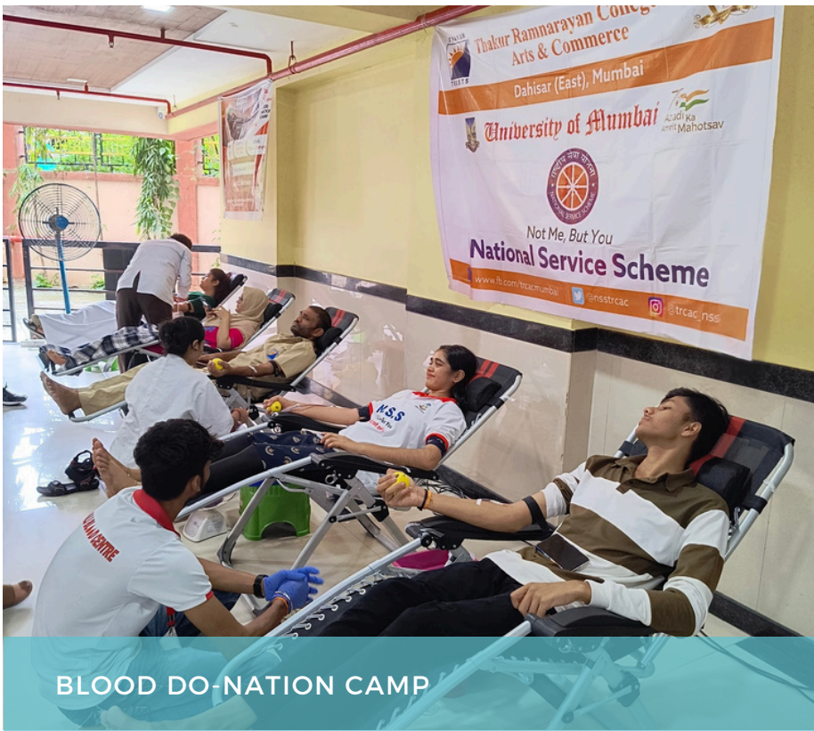
BLOOD DO-NATION CAMP

A Blood Donation Camp was organised in association with the Rotary Club of Upper Kandivali through which 80 bottles of blood were collected at Borivali Station and 111 units were collected at the college campus.