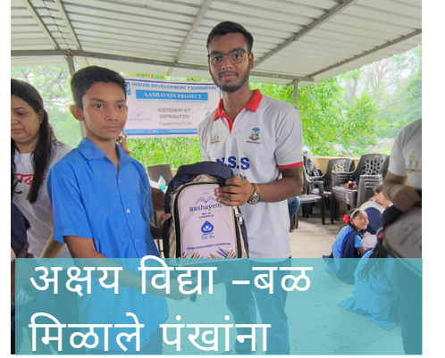
अक्षय विद्या -बळ मिळाले पंखांना