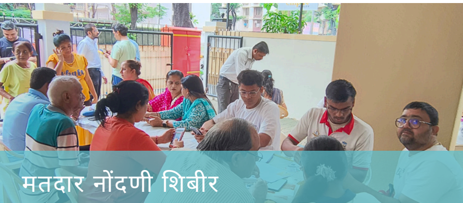
मतदार नोंदणी शिबीर