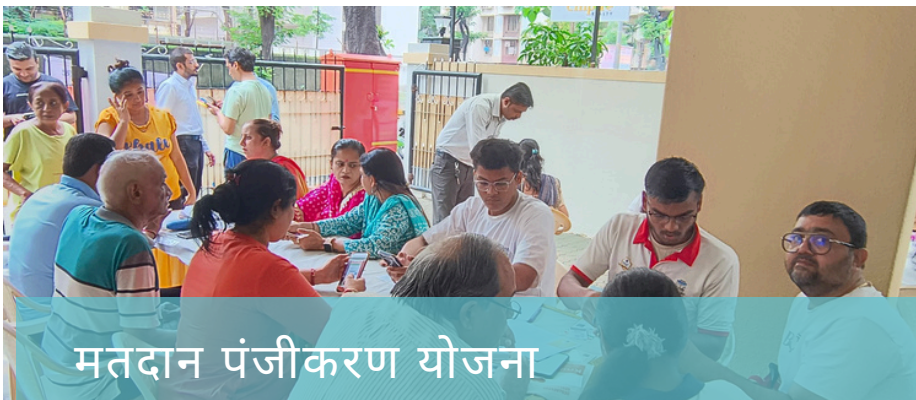
मतदान पंजीकरण योजना

स्वयंसेवकों की मदद से, दहिसर तालुका के चुनाव आयोग के साथ मिलकर हर रविवार को एक कैम्प का आयोजित किया। इस कैम्प का उद्देश्य बोरीवली से दहिसर तक के निवासियों को उनके मतदान प्रमाण पत्र प्राप्त करने में मदद करना है।