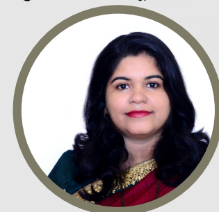
सम्पादकीय सौ. सायली परेरा