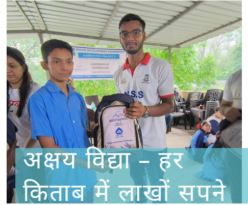
अक्षय विद्या - हर किताब में लाखों सपने

अक्षयशक्ति के साथ मिलकर एक प्रेरणादायक पहल "अक्षय विद्या - हर किताब में लाखों सपने" का आयोजन किया। उन्होंने दहानू के ग्रामीण क्षेत्रों में १७०० से अधिक शैक्षणिक सामग्री जरूरतमंद बच्चों में दान किए। स्वयंसेवकों ने इन सामग्रियों को इकट्ठा करने, सही तरह से तैयार करने और वितरण करने में अपना योगदान दिया।