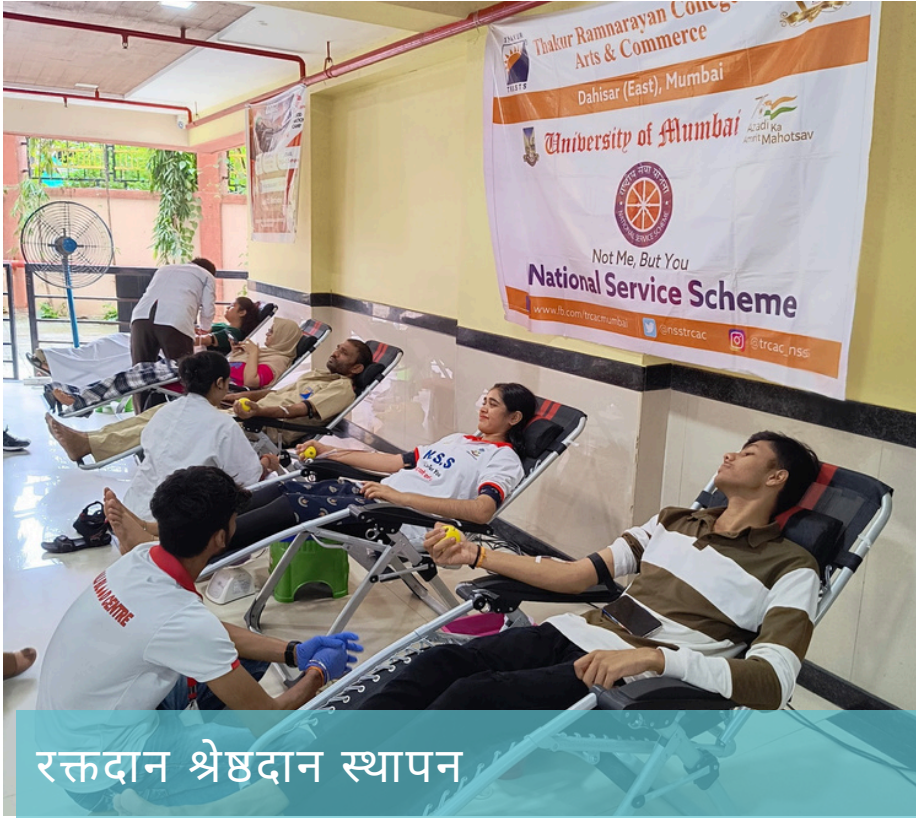
रक्तदान श्रेष्ठदान स्थापन

अपर कांदिवली 'रोटरी संघ' के सहयोग से बोरीवली स्टेशन और कॉलेज कैम्पस में बोरीवली ब्लड बैंक के साथ एक रक्तदान शिविर का आयोजन किया। यह आयोजन पूरी तरह से सफल रहा, जिसमें बोरीवली स्टेशन पर रक्त की ८० बोतलें एकत्र की गईं और कॉलेज कैम्पस में १११ रक्त के यूनिट्स एकत्र किए गए।