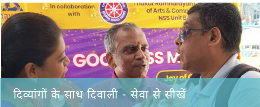
दिव्यांगों के साथ दिवाली - सेवा से सीखें