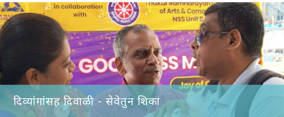
दिव्यांगांसह दिवाळी - सेवेतुन शिका