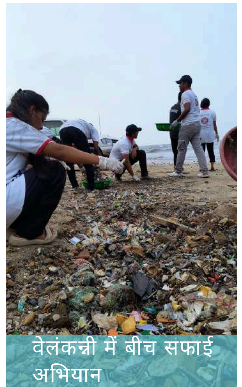
वेलंकन्नी में बीच सफाई अभियान