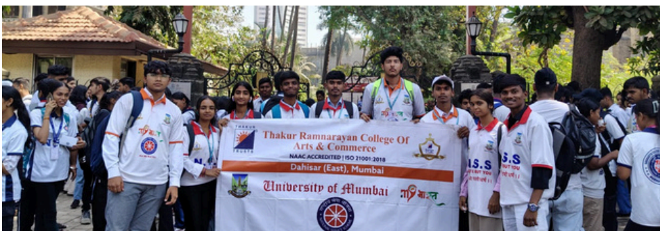
POWER OF THE CONSTITUTION: NSS AT SAMVIDHAN AMRUT MAHOTSAV