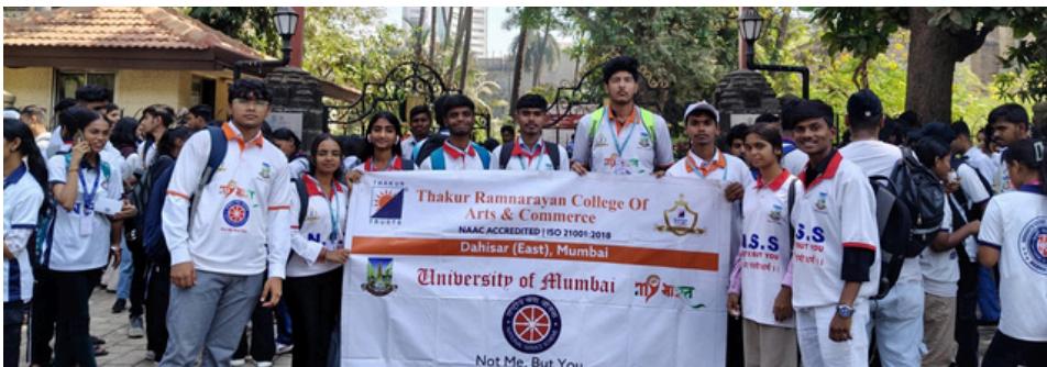
संविधान की शक्ति: संविधान अमृत महोत्सव में राष्ट्रीय सेवा योजना की भागीदारी