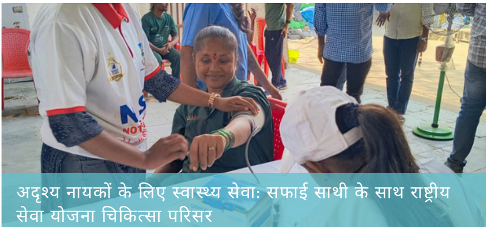
अदृश्य नायकों के लिए स्वास्थ्य सेवा: सफाई साथी के साथ राष्ट्रीय सेवा योजना चिकित्सा परिसर