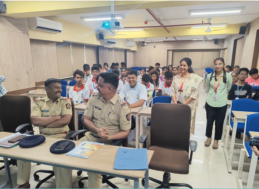
सायबर शिल्ड: विद्यार्थ्यांना डिजिटल धोके टाळण्यासाठी सक्षम बनवणे

'कुछ और इम्पॅक्ट शोकेस' अंतर्गत विद्यार्थ्यांना एका खऱ्या आयपीएस अधिकाऱ्याच्या अद्भुत प्रवासाने प्रेरित केले, जो एकेकाळी १२वीच्या परीक्षेत अनुत्तीर्ण झाला होता. त्यांची चिकाटी, आत्मविश्वास आणि दृढनिश्चय यांची कहाणी हे अधोरेखित करते की अपयश म्हणजे शेवट नव्हे, तर यशाकडे जाण्याचा एक महत्त्वाचा टप्पा आहे.