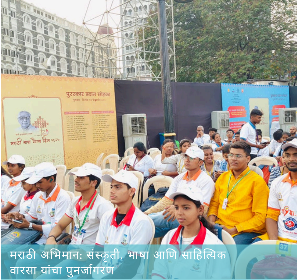
मराठी अभिमान: संस्कृती, भाषा आणि साहित्यिक वारसा यांचा पुनर्जागरण