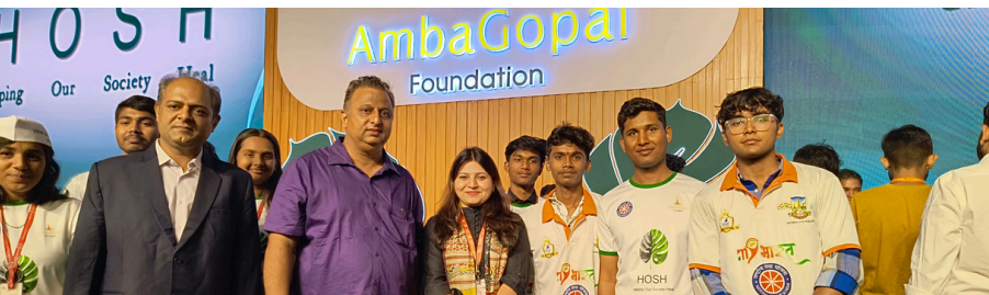
बदलासाठी पाऊल: NSS युनिटने BPL मिनी मॅरेथॉन २०२५ मध्ये कुष्ठरोग जनजागृतीसाठी पुढाकार घेतला