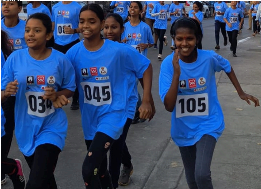
RUN FOR FITNESS, RUN FOR LIFE: NSS AT KALINA MINI MARATHON

The NSS Unit participated in the Kalina Mini Marathon to promote health and fitness. Students, faculty members, and fitness enthusiasts came together to embrace an active lifestyle. Medals and certificates were awarded to top performers, reinforcing the importance of regular exercise for overall well-being.