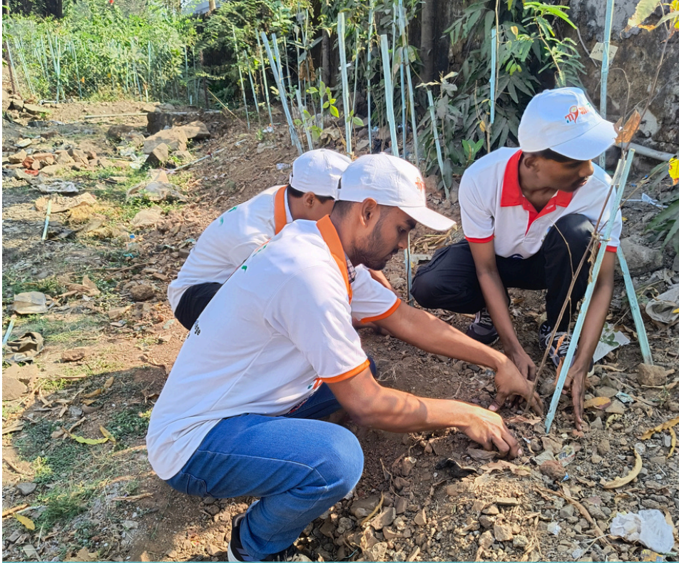
परिवर्तन की जड़ें: हरित क्रांति के साथ मुंबई का रूपांतरण

मुंबई विश्वविद्यालय में आयोजित संविधान अमृत महोत्सव में भारत के संवैधानिक मूल्यों और सुशासन का उत्सव मनाया गया। इस कार्यक्रम में एक वरिष्ठ IAS अधिकारी और एक राज्य मंत्री ने भाग लिया, जिन्होंने जिम्मेदार नागरिकता और लोकतांत्रिक सहभागिता पर अपने विचार साझा किए। राष्ट्रीय सेवा योजना के स्वयंसेवकों ने इस अवसर पर सार्थक चर्चाओं में भाग लिया और संवैधानिक जागरूकता के समाज पर पड़ने वाले प्रभावों पर विचार-विमर्श किया।