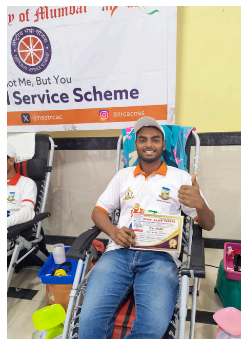
BE A HERO: NSS BLOOD DRIVE SAVES LIVES & HONORS MARTYRS