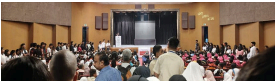
असफलता से प्रसिद्धि तक: एक आईपीएस अधिकारी की सफलता की यात्रा