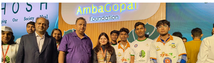
STRIDE FOR CHANGE: NSS CHAMPIONS LEPROSY AWARENESS AT BPL MINI MARATHON