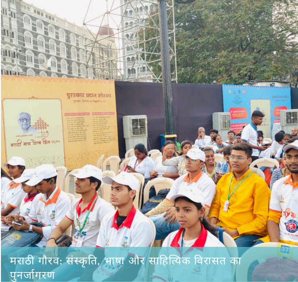
मराठी गौरव: संस्कृति, भाषा और साहित्यिक विरासत का पुनर्जागरण

महाराष्ट्र की समृद्ध साहित्यिक और सांस्कृतिक विरासत का सम्मान करने के लिए मराठी भाषा दिवस मनाया गया। इस कार्यक्रम में शिक्षा और सामाजिक सुधार में अहिल्याबाई फुले के योगदान को प्रमुखता से उजागर किया गया। छात्रों ने चर्चाओं और प्रदर्शनियों में भाग लिया, जिससे मराठी साहित्य और इतिहास के प्रति उनकी सराहना और जागरूकता बढ़ी।