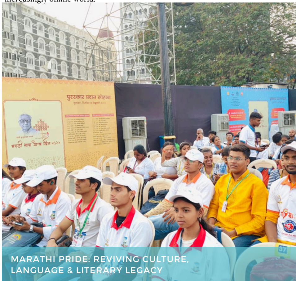
MARATHI PRIDE: REVIVING CULTURE, LANGUAGE & LITERARY LEGACY

Marathi Bhasha Diwas was celebrated to honor Maharashtra's rich literary and cultural heritage. The event highlighted the contributions of Ahilyabai Phule to education and social reform. Students engaged in discussions and performances, fostering appreciation for Marathi literature and history.