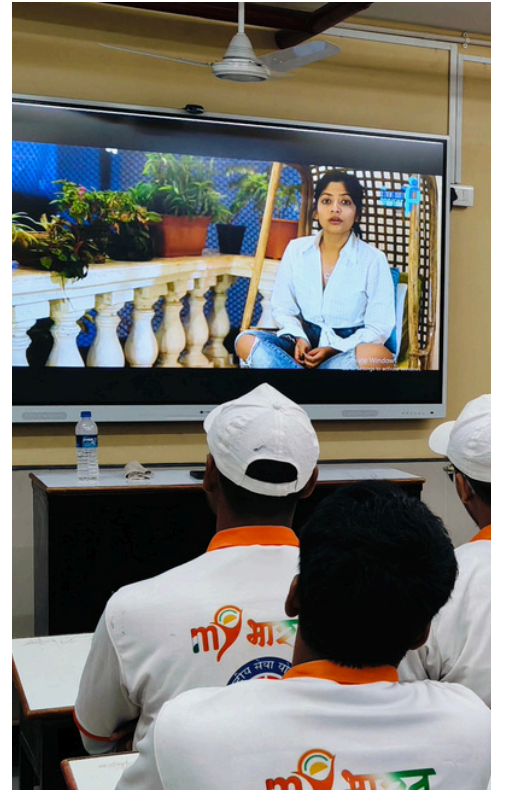
निर्दोषिता की रक्षा