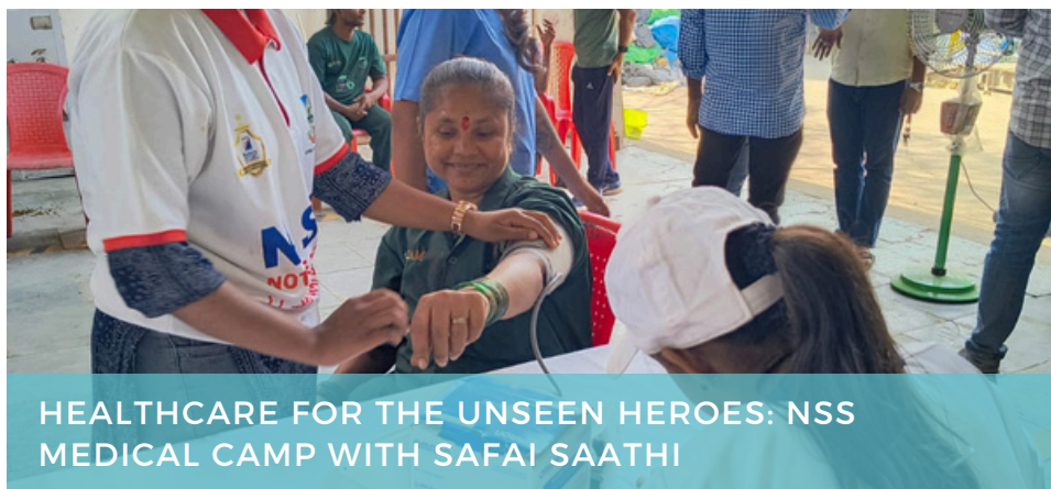
HEALTHCARE FOR THE UNSEEN HEROES: NSS MEDICAL CAMP WITH SAFAI SAATHI