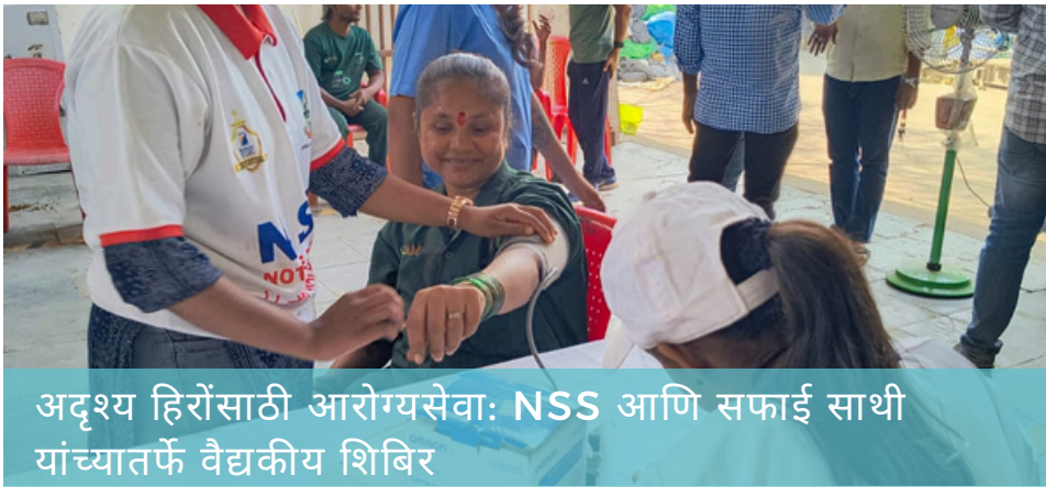
अदृश्य हिरोंसाठी आरोग्यसेवा: NSS आणि सफाई साथी यांच्यातर्फे वैद्यकीय शिबिर