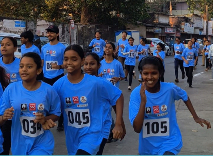
फिटनेससाठी धावा, जीवनासाठी धावा: कलिना मिनी मॅरेथॉनमध्ये NSS चा सहभाग

NSS युनिटने बॉम्बे लेप्रसी प्रोजेक्ट द्वारे आयोजित BPL मिनी मॅरेथॉन २०२५ मध्ये उत्स्फूर्त सहभाग घेतला. या उपक्रमाचा उद्देश कुष्ठरोग निर्मूलन, लवकर निदान आणि सामाजिक कलंक दूर करण्याविषयी जनजागृती करणे हा होता. स्वयंसेवकांनी "कुष्ठरोगमुक्त भारत" असा संदेश देणारी फलक आणि बॅनर्स हातात घेत समाजात सकारात्मक बदल घडवण्याचा संदेश दिला.