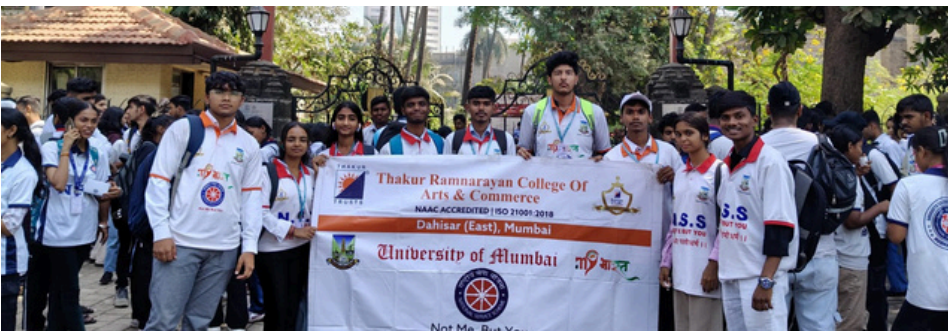
POWER OF THE CONSTITUTION: NSS AT SAMVIDHAN AMRUT MAHOTSAV