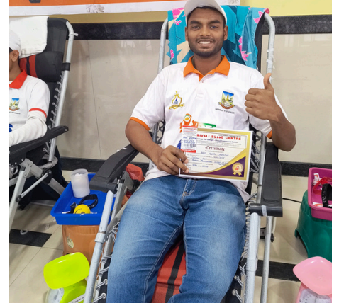
हीरो बनें: राष्ट्रीय सेवा योजना रक्तदान शिविर - जीवन बचाए, शहीदों को श्रद्धांजलि