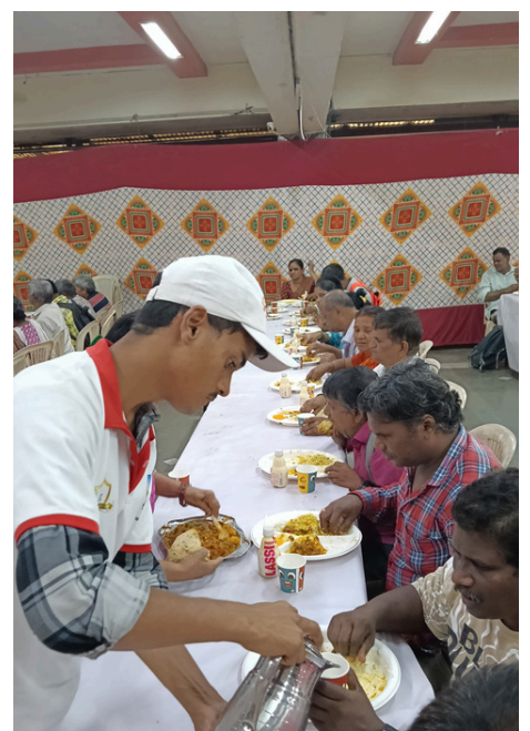
SERVING WITH LOVE